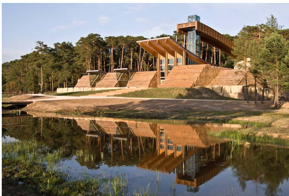
Figura 4. Casa de la Madera. Comunero de Revenga (Burgos).

El fomento en la zona del uso de la madera como material moderno apto para gran cantidad de soluciones arquitectónicas se centra en un edificio de arquitectura vanguardista de madera (Figura 4) ubicado en un lugar emblemático, próximo a la ermita de Ntra. Señora de Revenga (Burgos). La inversión ha ascendido a 2.300.000 € (Junta de Castilla y León 1.100.000 € para el edificio y 150.000 € para la dotación, Diputación de Burgos 500.000 €, Caja de Burgos 400.000, Ayuntamientos del Comunero de Revenga 150.000 €). La Casa de la Madera se abrió al público en junio de 2.008, y hasta diciembre de ese año recibió 30.000 visitantes. La Fundación del Patrimonio Natural de Castilla y León se encarga de la gestión del edificio.