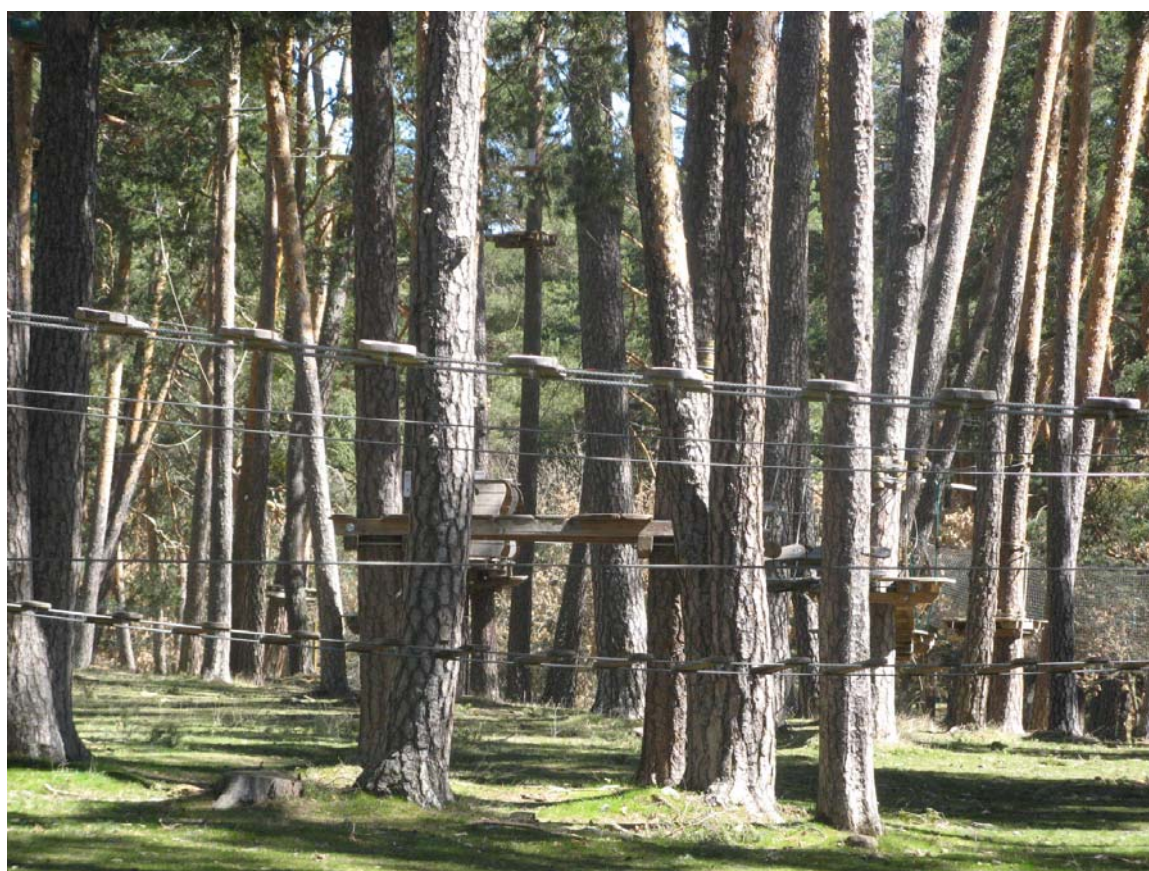
Figura 5. Vista parcial del Parque de aventura de Revenga (Burgos.).

La oferta de ocio de aventura asociada al monte se ha completado con la apertura de dos parques forestales de aventura: los Parques de Aventura Forestal de Revenga y del Amogable. El primero de ellos ha supuesto una inversión de 350.000 € de los que 69.000 han sido aportados por la Junta de Castilla y León, y el resto por la empresa que lo explota en régimen de concesión. Ocupa una extensión total de 7 ha, lo que le convierte en el mayor de España. Este Parque abrió el mes de marzo de 2008 y en los nueve meses de ese año recibió 9.000 visitantes. La Figura 5 muestra un sector de este parque de aventura.