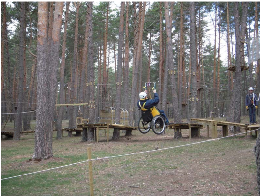
Figura 6. Discapitado físico utilizando el Parque de aventura de El Amogable (Soria.).

La Ley 12/2008, de 9 de diciembre, crea el Parque Natural de las Lagunas Glaciares de Neila (Burgos), con 6.290 ha. Durante los años 2002 y 2003 se llevó a cabo un ambicioso proyecto de restauración y renaturalización de algunas de las áreas lagunares e higróturbosas que habían sido transformadas en los años 70 en embalses artificiales para la práctica de la pesca intensiva de trucha, con una inversión aproximada de 1.200.000 €. En este Parque se mantienen en buen estado de conservación algunos de los mejores vestigios glaciares del Sistema Ibérico Norte. Junto al interés geomorfológico, conviven una gran variedad de ecosistemas y especies singulares, entre las que habitan 25 especies del Catálogo de Flora Protegida de Castilla y León entre las que destaca el raro helecho acuático Isoetes equinosporum .