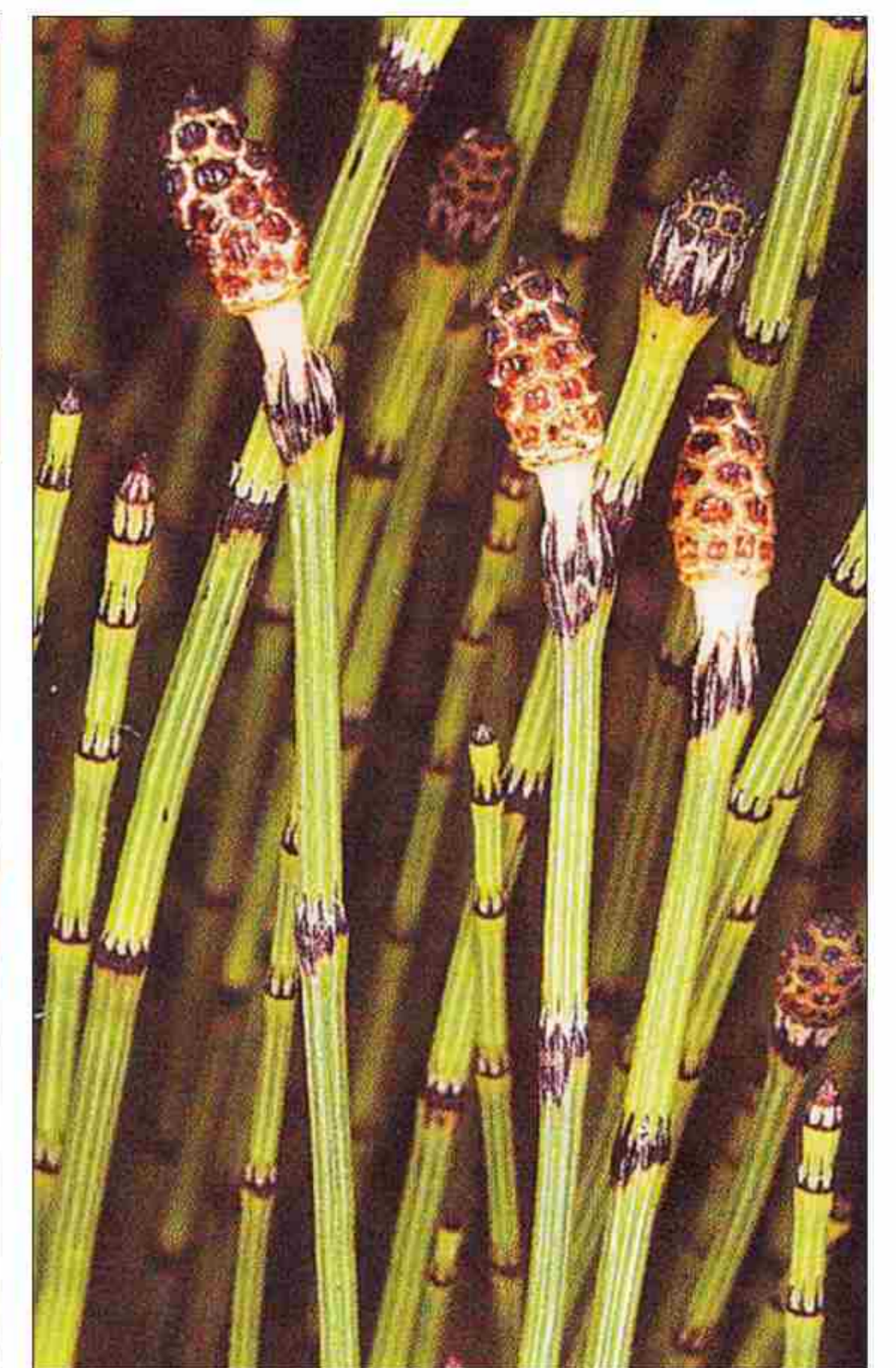
▶ Equisetum variegatum .