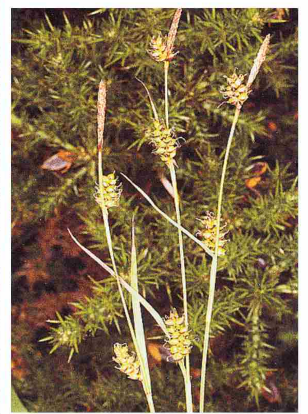
▶ Carex caudata .