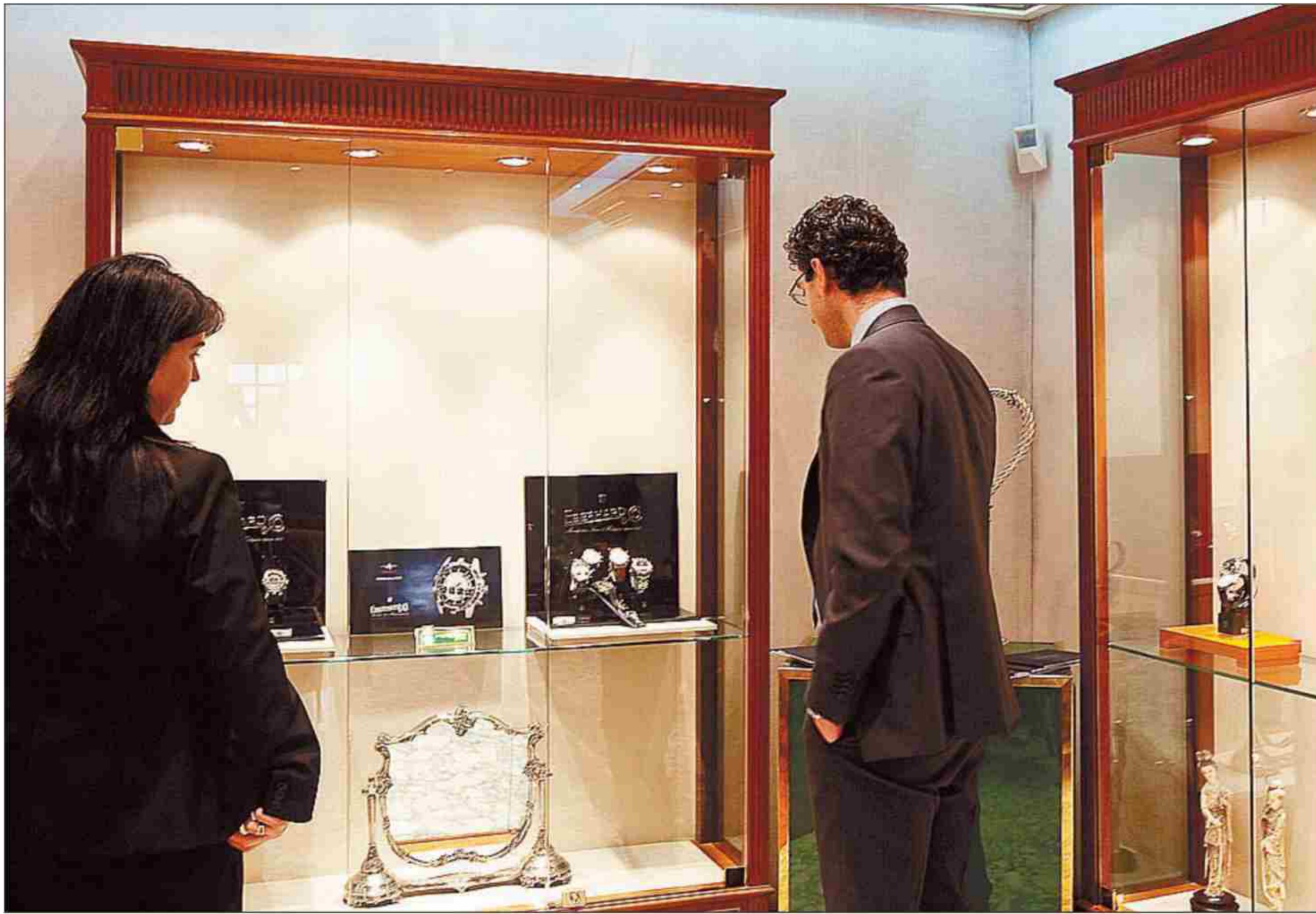
Exposición de alta relojería. La joyería Perodri (Moneda, 7) acogió ayer una exposición de relojes Eberhard&Co. con motivo de la celebración del 125 aniversario de la marca de manufactura de alta relojería. También se vieron las joyas conmemorativas del 50 aniversario de Perodri.