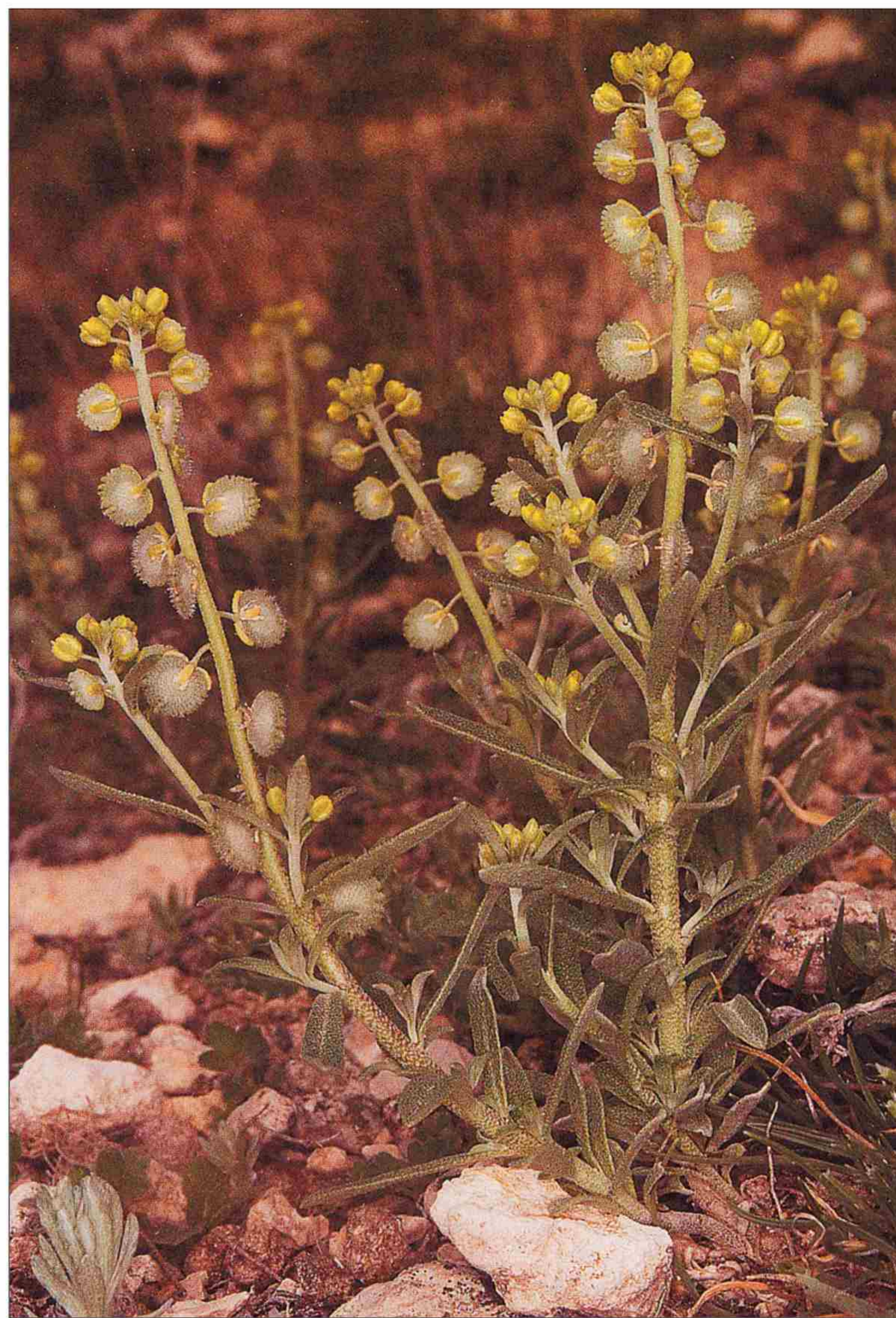
▶ Clypeola cyclodonteia .