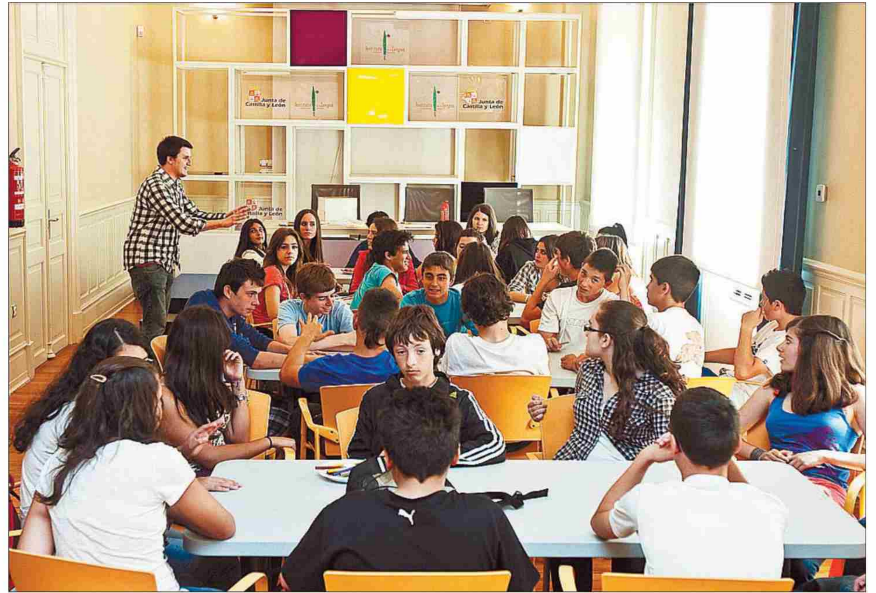
Estudiantes en La Isla de las Letras. Este grupo de estudiantes del Instituto de Enseñanza Secundaria Camino de Santiago pasó la mañana de ayer en la actividad La Isla de las Letras organizada por el Instituto de la Lengua con el fin de darles a conocer la historia y la evolución del español.